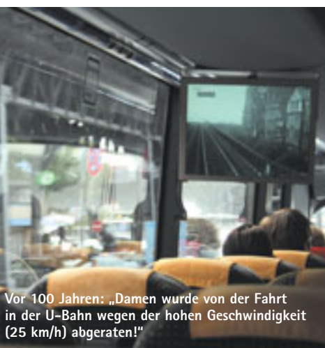
Vor 100 Jahren: „Damen wurde von der Fahrt in der U-Bahn wegen der hohen Geschwindigkeit (25 km/h) abgeraten!“

Auf sehr angenehme Weise erfährt auch der gut informierte Hamburger durch Stefan Petzholds tollen Vortrag auf dieser Abenteuerreise noch Neues über seine Stadt. Und die Begegnung zwischen Gegenwart, Vergangenheit und Zukunft lässt sich kaum direkter reproduzieren als bei dieser fast dreieinhalbstündigen Zeitreise. ◆