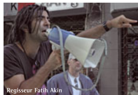
Regisseur Fatih Akin